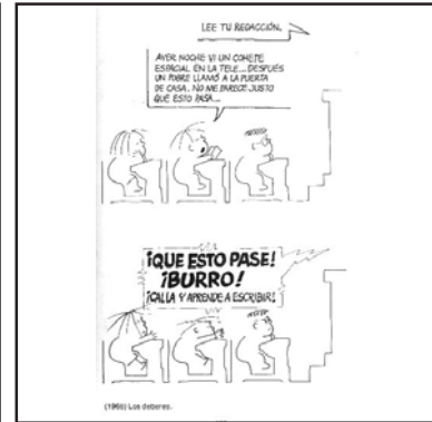
3. Problemas de redacción.