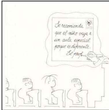
1. Aula especial porque es diferente.