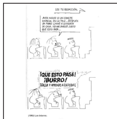
3. Problemas de redacción.

Con estas tres viñetas se plantean situaciones comunes en algunas prácticas "educativas" y "escolares". Por eso, aunque esta actividad está dirigida a los alumnos, puede servir también como reflexión para educadores.