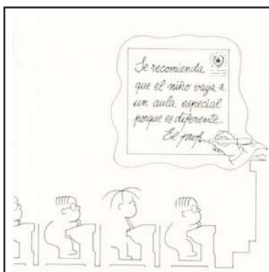
1. Aula especial porque es diferente.